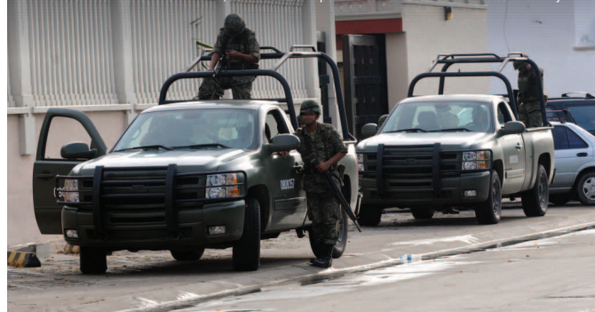
Edición del 5 de octubre de 2010.

Desde una camioneta en movimiento, delincuentes disparan en más de 40 ocasiones con AK-47 y AR-15