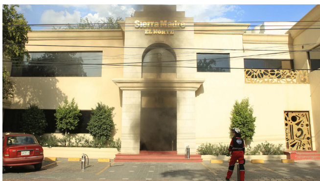
Las instalaciones de Sierra Madre, una filial del diario El Norte, después de un ataque sufrido el 29 de Julio de 2012.