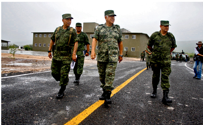
Retén militar en Michoacán, agosto 2012.

La solución a la crisis de violencia que azota actualmente a la prensa en México depende del Estado. Este, a través de sus tres niveles, debe poner fin a la impunidad, motor de los ataques contra los medios y sus profesionales.