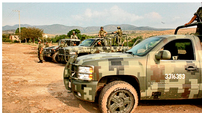
Elementos del Ejército durante operación de seguridad en Guanajuato. Agosto 2012.

Dichas agresiones se dan cuando profesionales de medios cubren casos de corrupción, de colusión entre autoridades y crimen organizado, y otras actividades ilícitas. Los índices de percepción de la corrupción en México han aumentado considerablemente de 2007 al 2011 26 . El periodista y académico Eugênio Bucci afirma: “poder Judicial que no juzga, policía que no investiga, gobernadores que se deslindan de su responsabilidad, traficantes que sobornan políticos, milicias que promueven masacres: todos son exponentes distintos de una misma máquina que viene minando el Estado de Derecho y amenazando la libertad” 27 .